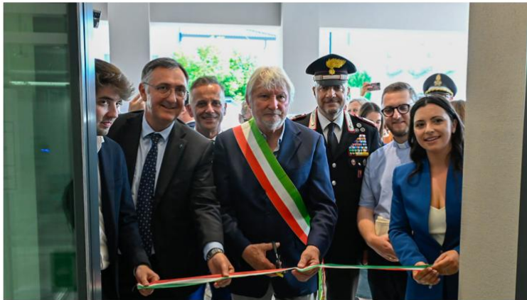
Il momento dell'inaugurazione

Inaugurato venerdì 29 maggio il nuovo presidio della Cassa Rurale FVG